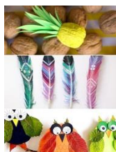
Fabrication de petits objets nature