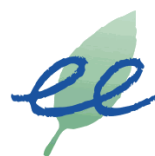
Ecologistes de l'Euzière Formation Ecologistes de L'Euzière