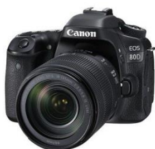
Photographie (Paysage, macro,...)