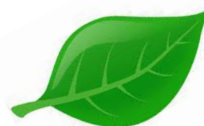
Approches sensibles Art et Nature Découverte Naturaliste d'un site du Parc